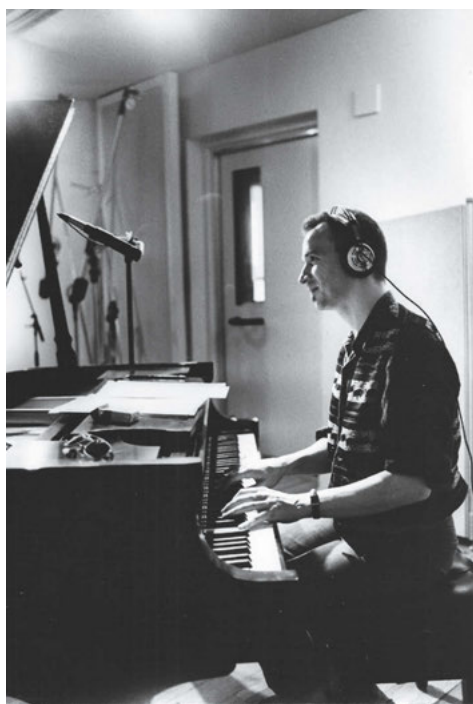
Un Steinway B choisi, s'il vous plaît, au Steinway Hall de la Big Apple. Le grand luxe !