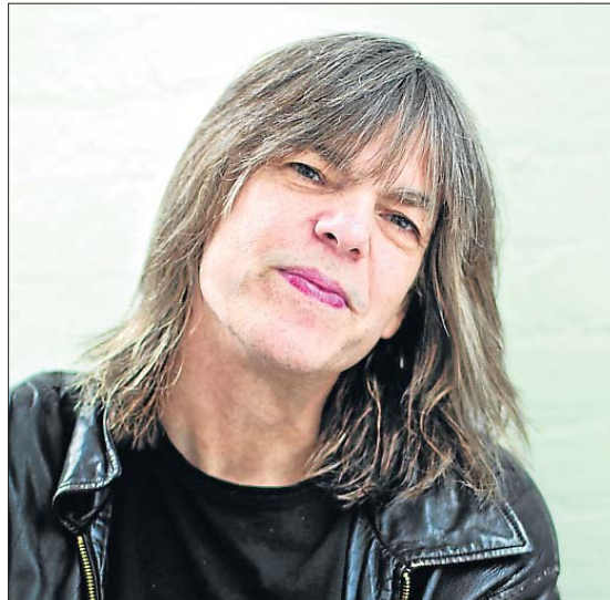
Le maître guitariste Mike Stern.

Le centre culturel convie à la deuxième édition de son festival