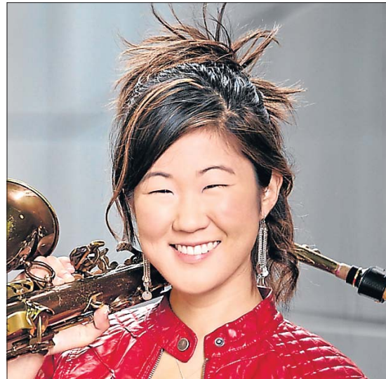
La saxophoniste Grace Kelly.

Le centre culturel «opderschmelz» à Dudelange a dévoilé l'affiche de son festival «Like a jazz machine», qui se déroulera du 9 au 12 mai prochains. Il s'agira de la deuxième édition d'un festival très jeune encore, mais qui dès sa création en 2012 avait convaincu par la qualité de son affiche et séduit un public venu en nombre.